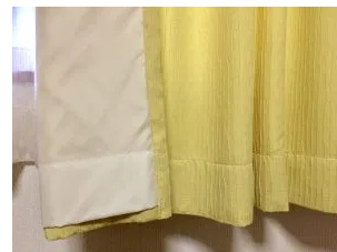
▲裏地付きカーテン