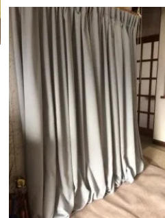
裾を長めにして冷気を防ぐ▶